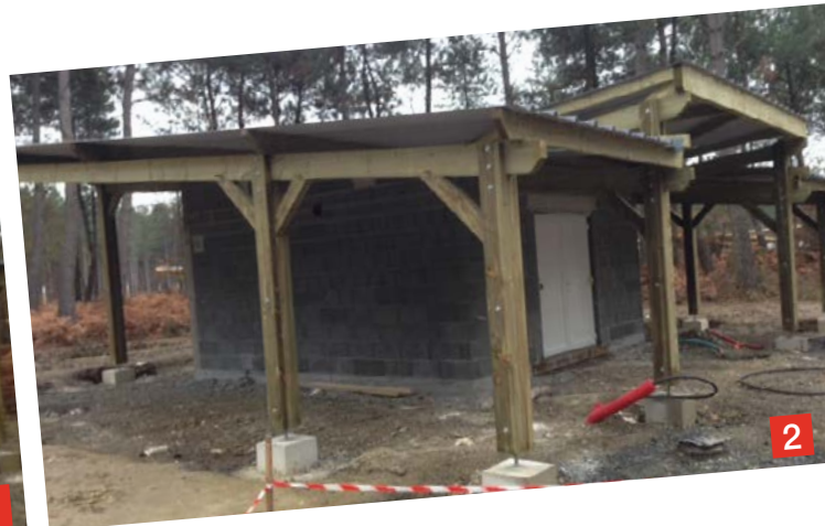
1 - 2 Elévation locaux cleaning